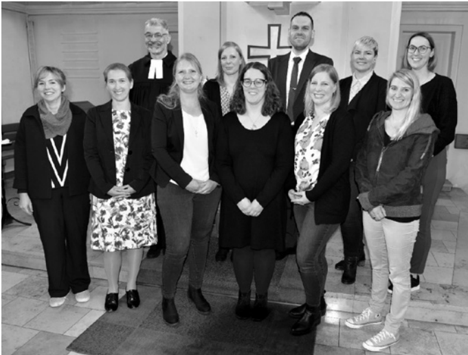
„Silberne Konfirmation“ feierten die Jüngsten der Jubelkonfirmanden