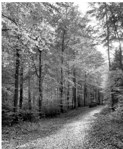
Der Naturlehrpfad führt idyllisch durch den Epfenbacher Wald.

Zweimal im Monat werden Highlights und bisher wenig bekannte Geheimtipps der Sinsheimer Erlebnisregion vorgestellt. Heute an der Reihe: Der Naturlehrpfad Epfenbach und der Maulwurf-Trail von Epfenbach nach Spechbach.