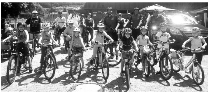
Start zur gemütlichen Tour