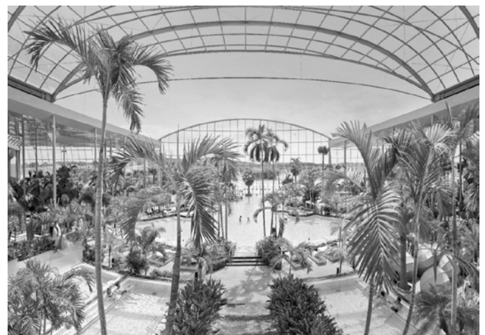
Das Palmenparadies mit auffahrbarem Panoramadach ist eines der Highlights der Thermen & Badewelt Sinsheim.

Weitere Informationen gibt es auf der Website www.badewelt-sinsheim.de .