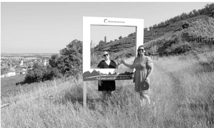
Beim Fotowettbewerb „Sommer im Kreis“ sind der Kreativität keine Grenzen gesetzt – die einzige Bedingung: Das Foto muss mit einem der fünf Landschaftsfotorahmen aufgenommen werden.

Das Landratsamt freut sich auf zahlreiche kreative Einsendungen und wünscht allen Teilnehmenden viel Spaß beim Fotografieren und einen wunderschönen Sommer im Rhein-Neckar-Kreis. Weitere Informationen sowie die Teilnahmebedingungen sind unter www.rhein-neckar-kreis.de/fotowettbewerb zu finden.