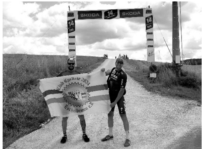
Delegation des CCE mit der Vereinsflagge auf der Einfahrt zum ersten Schotterabschnitt der 9. Etappe der Tour de France 2024.

Zum guten Ergebnis trug sicherlich der Besuch der Tour de France einer Delegation des CCE mit dem Rad bei. Hier wurden binnen 3,5 Tagen 928,5 Kilometer zurückgelegt (Nettofahrtzeit: knapp 38 Stunden). Dies war sicher nicht immer ein Zuckerschlecken, doch im Rückblick betrachtet ein episches Unterfangen, das Wiederholung finden sollte - gerne mit einer größeren Gruppe.