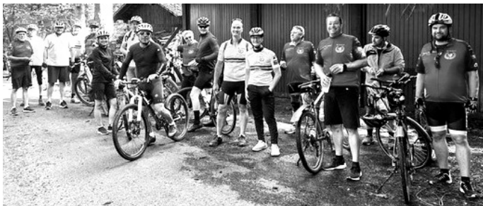
Die sportlichen Fahrer und Fahrerinnen in Walldorf beim Planetenmodell